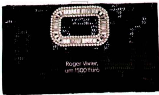
Roger Vivier, um 1500 Euro