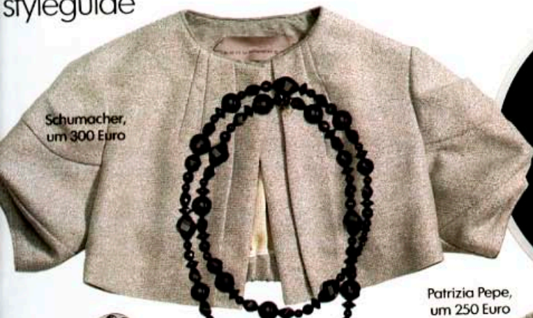
Schumacher, um 300 Euro