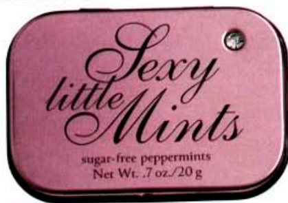
Minzpastillen von Victoria's Secret, um 3 Euro