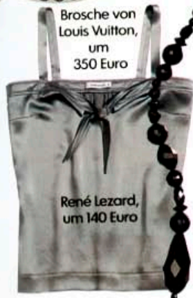
Brosche von Louis Vuitton, um 350 Euro

"Girls just wanna have fun" – und dazu gehören bewundernde Blicke von netten Männern am Nebentisch. Eine sexy Glanzkombi aus Seidentop und Lurex-jäckchen begeistert nicht nur beste Freundinnen und wirkt mit schwarzen Röhrenjeans erst richtig unwiderstehlich. Noch schärferes Paar: Minirock und blickdichte Leggings. Dazu silberfarbene Highheels . Tipp: Selbst wenn sie keiner sieht, Spitzendessous sorgen für erotische Ausstrahlung. Immer dabei: ein Miniadressbuch , zum Beispiel von Smythson, zur eventuellen Aufnahme von Personalien. Man weiß ja nie!