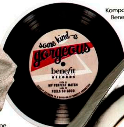
Kompakt-Make-up von Benefit, um 30 Euro