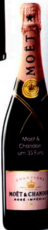
Moët & Chandon um 35 Euro