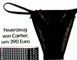
Feuerzeug von Cartier, um 390 Euro